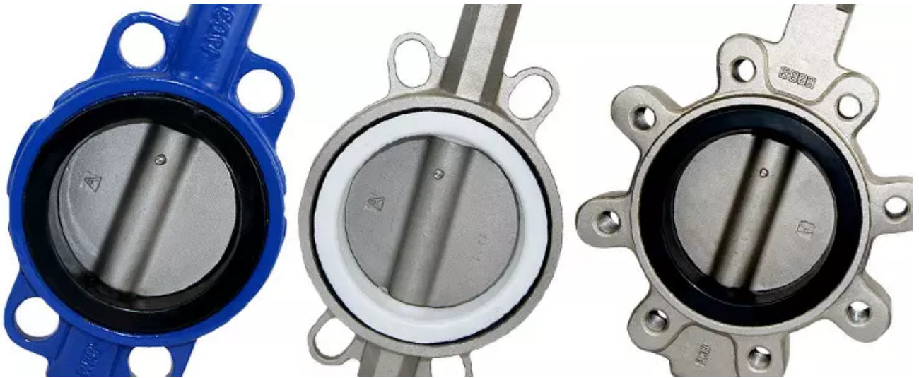
Optional Electric Actuated and Pneumatic Actuated